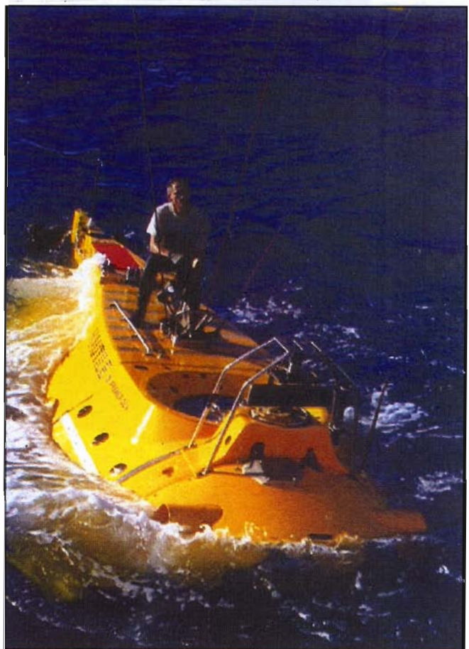
हिन्द महासागर में फ्रांसीसी पंडुब्बी