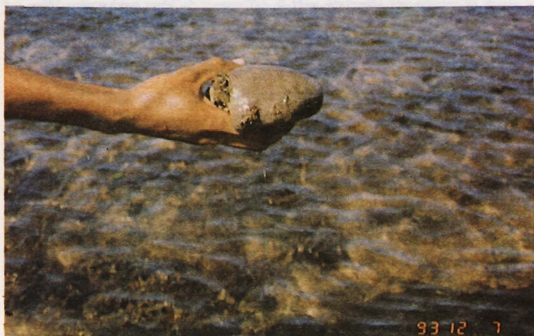
चित्र 4: जीवित प्रवाल और शैवाल ।