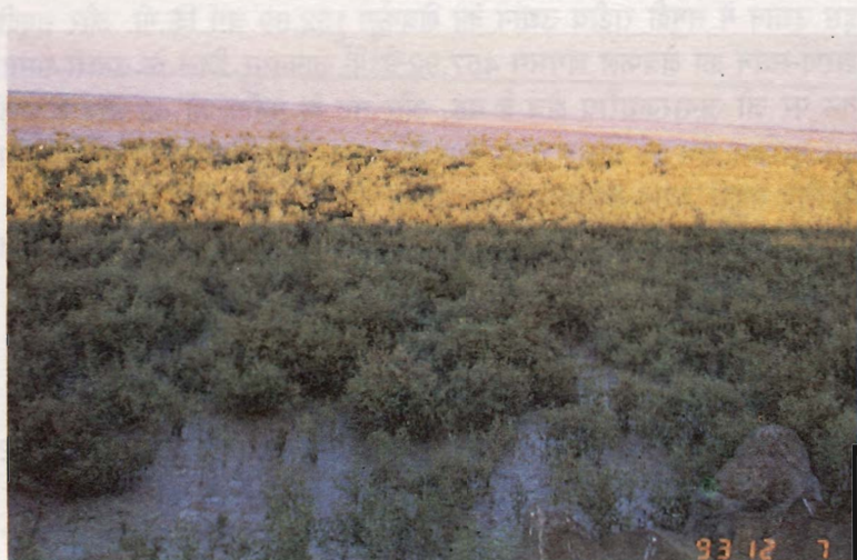
चित्र 1: कच्छ की खाड़ी में बसे हुए “कच्छ वनस्पति” के जंगल ।