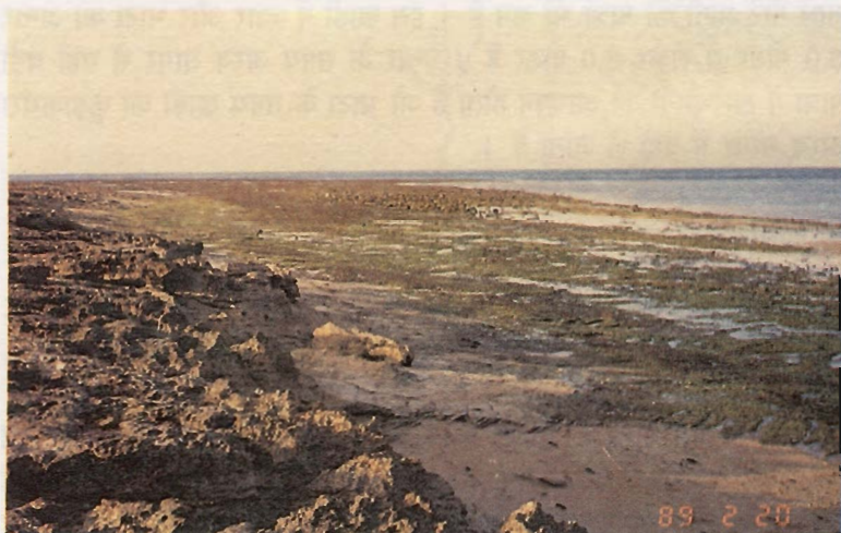
चित्र 2: कच्छ वनस्पति के कटने से तट का भूमि कटाव ।