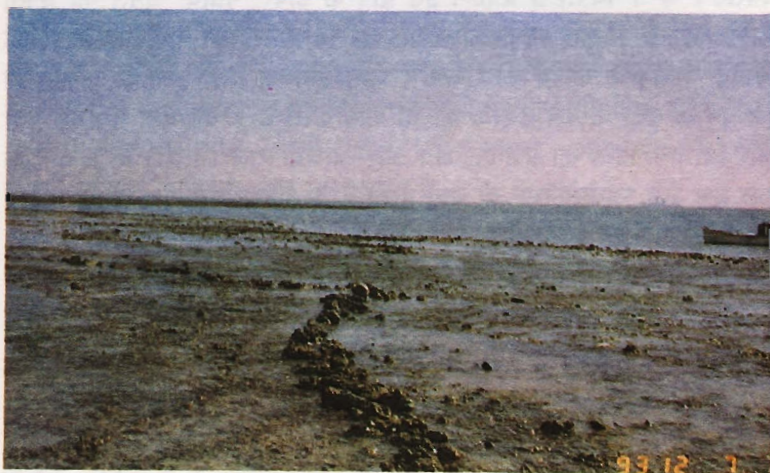
चित्र 3: "कच्छ वनस्पति" के कटाव से कीचड़ की बड़ी हुई मात्रा में दबे हुए द्वीप ।