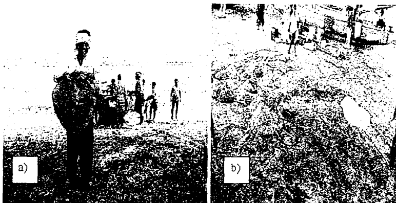
चित्र 3 a) मछुआरे मछली पकड़ने वाली उनकी नाव के साथ एवं स्टिंग रे मछली दर्शाता मछवारा b) भारत के पूर्वी तट पर स्टिंग रे पकड़ते हुए मछवारे

दो विदेश में इन प्रजातियों की बढ़ती हुई मांग तथा उत्पादन से मिलता हुआ लाभ और असंतुलित मत्स्य उद्योग से उपयोगी मुनाफा। भारत में एलास्मोबेकिआइ (Elasmobranch) मछलियों का निर्यात व व्यापार हर साल में करीब 70,000 टन से अधिक होता है और राज्य के सभी स्थानीय बंदरगाहों पर इसका सर्वेक्षण भी किया जाता है पर कभी कभी बड़ी नौका, ट्रॉल पर आक्रामिक मिलनवाली यह प्रजातियां के अवयव काटकर वचा हुआ भाग पानी में फेंका जाता है। इसके बारे में कोई जानकारी या रिकॉर्ड नहीं रखा जाता। इस वजह से कुछ प्रजातियां दुर्लभ हो जाती हैं।