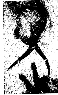
चित्र 2 - हिप्पोकैम्पसट्राइमैक्युलेटस की प्रजनन अवस्था

इनकी एक उल्लेखनीय विशेषता यह है की नरों में कंगारू की तरह धैला होता है जिसे बुडपाऊच कहते है। सी हार्स में प्रणय संगम अवधी बहुत ही कम होता है। यदि उचित भोजन प्रदान किया जाय तो यह मछलियाँ लगातार गृहित परिस्थितियों में प्रजनन कर सकती है। यह देखा जाता है की प्रणय के अंतिम चरण मादा प्रेरीत होकर अपने अंडे पैनी नरके वच्चादानी धैला में स्थित करती है तथा इसके बाद अंडों का निषेचित और विकास होता है। नरों का वच्चादानी धैला संरक्षण, वातन, पोषण और विकास करता है। नर अपने शुक्राणुओं से एक नलिका के जरिए इन अंडों को संसोचित करते हैं। अन्य समुद्री सजावटी मछली की तुलना में सी हॉर्स में प्रजनन आसान पाया जाता है क्योंकि अन्य मछली की तरह सेक्स प्राकिया भूमिका से मुक्त है। तकरीबन 10-15 दिन बाद नर का धैला (बुडपाऊच) खुलता है। और सैकड़ों नवजात छोटे छोटे शिशु समुद्री घोड़े निकल आते हैं। किशोर संवर्धन की अवधि समस्याग्रस्त होती है क्योंकि जन्म के बाद से ही उनके पैलजीवी व्यवहार और इस अवधि के दौरान वे पानी में बुलबुलोंकी उछाल से हवा उनके शरीर में फसने के कारण इनकी मृत्यु हो जाती है। अनुपयुक्त जिवीत खाद के आकार के कारण किशोर समुद्री घोड़े खाद / खाना ग्रहन नहीं कर पाते पर खुद को जिवीत रखते हैं। इस समस्या के कारण जलीय शोधकर्ताओं को बहुत ही सामना करना पड़ रहा है। आजकल जिवीत अवधि तथा सी हॉर्स के गृहीत पालन संवर्धन से संबंधित समस्याएँ अधिक देखी जा सकती हैं। विशेष रूप से अमेरिका एवं युरोप जैसे देशों ने वाणिज्य के रूप में सी हॉर्स के पालन एवं अपनी आवांशकताओं को पूरा करने के लिए इन मछलियों को एकवेरीयम में एवं समुद्री व्यापार से यह जाना है कि यह मछली पालतु है।