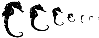
चित्र 3 हिप्पोकैम्पसकुड़ा के विकास रूपरेखा

इनकी एक उल्लेखनीय विशेषता यह है की नरों में कंगारू की तरह धैला होता है जिसे बुडपाऊच कहते है। सी हार्स में प्रणय संगम अवधी बहुत ही कम होता है। यदि उचित भोजन प्रदान किया जाय तो यह मछलियाँ लगातार गृहित परिस्थितियों में प्रजनन कर सकती है। यह देखा जाता है की प्रणय के अंतिम चरण मादा प्रेरीत होकर अपने अंडे पैनी नरके वच्चादानी धैला में स्थित करती है तथा इसके बाद अंडों का निषेचित और विकास होता है। नरों का वच्चादानी धैला संरक्षण, वातन, पोषण और विकास करता है। नर अपने शुक्राणुओं से एक नलिका के जरिए इन अंडों को संसोचित करते हैं। अन्य समुद्री सजावटी मछली की तुलना में सी हॉर्स में प्रजनन आसान पाया जाता है क्योंकि अन्य मछली की तरह सेक्स प्राकिया भूमिका से मुक्त है। तकरीबन 10-15 दिन बाद नर का धैला (बुडपाऊच) खुलता है। और सैकड़ों नवजात छोटे छोटे शिशु समुद्री घोड़े निकल आते हैं। किशोर संवर्धन की अवधि समस्याग्रस्त होती है क्योंकि जन्म के बाद से ही उनके पैलजीवी व्यवहार और इस अवधि के दौरान वे पानी में बुलबुलोंकी उछाल से हवा उनके शरीर में फसने के कारण इनकी मृत्यु हो जाती है। अनुपयुक्त जिवीत खाद के आकार के कारण किशोर समुद्री घोड़े खाद / खाना ग्रहन नहीं कर पाते पर खुद को जिवीत रखते हैं। इस समस्या के कारण जलीय शोधकर्ताओं को बहुत ही सामना करना पड़ रहा है। आजकल जिवीत अवधि तथा सी हॉर्स के गृहीत पालन संवर्धन से संबंधित समस्याएँ अधिक देखी जा सकती हैं। विशेष रूप से अमेरिका एवं युरोप जैसे देशों ने वाणिज्य के रूप में सी हॉर्स के पालन एवं अपनी आवांशकताओं को पूरा करने के लिए इन मछलियों को एकवेरीयम में एवं समुद्री व्यापार से यह जाना है कि यह मछली पालतु है।