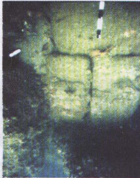
चित्र 2. महाबलीपुरम: जलमग्न पुरातात्विक अवशेष