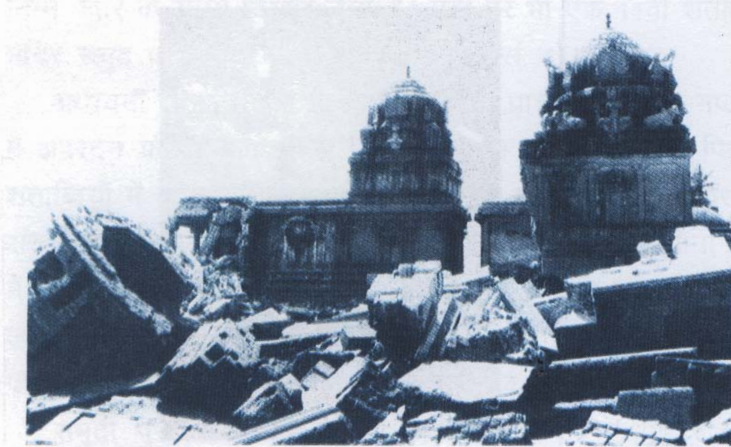
चित्र 4. तरंगखाड़ी: ग्यारहवीं शताब्दी के मंदिर के भग्नावशेष जो समुद्री लहरों से नष्ट हो गया