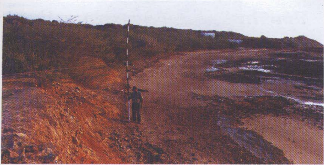
चित्र 1. बेट द्वारका उत्खनन के दौरान प्राचीनतम आवास स्तर एवं वर्तमान समुद्र स्तर का मापन