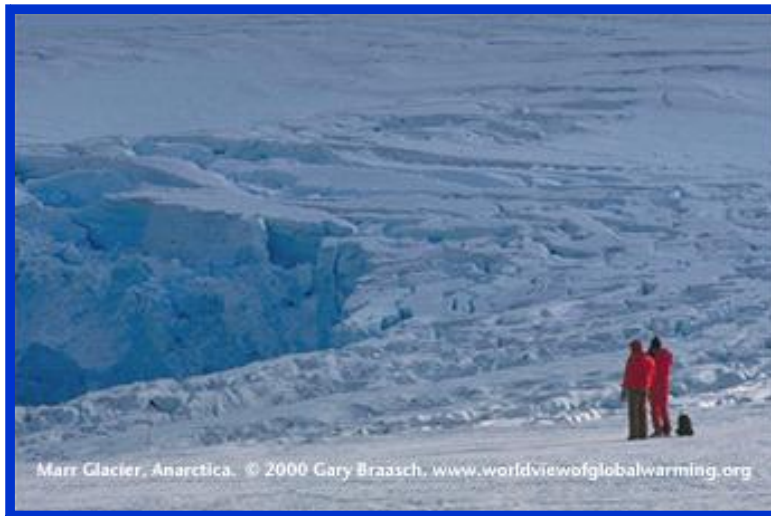
चित्र 4. अंटार्कटिक हिमखंड पर वैश्विक उष्णता के प्रभाव

और यह भी वैश्विक उष्णता का ही एक प्रभाव है। समुद्री जलस्तर के बढ़ने के कारण अनेकों द्वीपसमूह पानी में समा सकते हैं जिसके फलस्वरूप निवासियों के रहने के लिए कोई भू-क्षेत्र बचा नहीं रहेगा। फसल के लिए उर्वर भूमि भी जलमग्न हो सकती है जिसके परिणाम में दुनिया के लिए भोजन की आपूर्ति कम हो जाएगी। दुनिया भर में अनाज के रूप में प्रयुक्त कई फसलें तटीय क्षेत्रों में बड़े पैमाने पर उगाई जाती हैं, और इन क्षेत्रों में बाढ़ आने से यह फसल प्रभावित हो सकती है। समुद्रों का यह बढ़ता जलस्तर अनाज के उत्पादन में इतनी कमी ला सकता है जिससे कि पूरी दुनिया की आबादी प्रभावित हो सकती है। वैश्विक उष्णता की वजह से बर्फ की टोपी पिघलने से धीरे धीरे समुद्र का जलस्तर बढ़ रहा है, और साथ ही समुद्र के