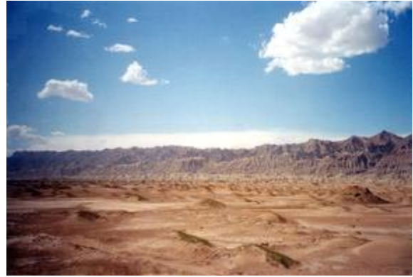
चित्र- 2 वैश्विक उष्णता की वजह से मौसम में बदलाव की एक झलक

पृथ्वी पर वैश्विक उष्णता के प्रभाव अनेक प्रकार के हैं हालांकि उन सभी प्रभावों को नकारात्मक नहीं कहा जा सकता है फिर भी उनका समग्र प्रभाव अच्छा नहीं है। मौसम और बारिश का पैटर्न बदलने से तूफानों और अन्य घटनाओं का बुरा प्रभाव पड़ सकता है और इसकी वजह से जिन क्षेत्रों में बहुत वर्षा होती है उनका अब रेगिस्तान के रूप में अंत हो सकता है। वैश्विक उष्णता को रोकने के लिए या उसके बुरे प्रभावों से पृथ्वी की रक्षा के लिए अनेकों उपायों पर विचार किया जा सकता है इसके लिए वास्तविक ऊर्जा संरक्षण सबसे प्रभावी तरीका है। इसका मतलब है कि यह जीवाश्म ईंधन के ऊर्जा स्रोतों या अन्य प्रकार के ऊर्जा स्रोतों का न्यूनतम उपयोग करना चाहिये जिससे ग्रीन हाउस गैसों के उत्सर्जन पर रोक लग सके। इसके बजाय, जैसे बायोमास ऊर्जा और पृथ्वी के अनुकूल वैकल्पिक ऊर्जा के स्रोतों का उपयोग करें।