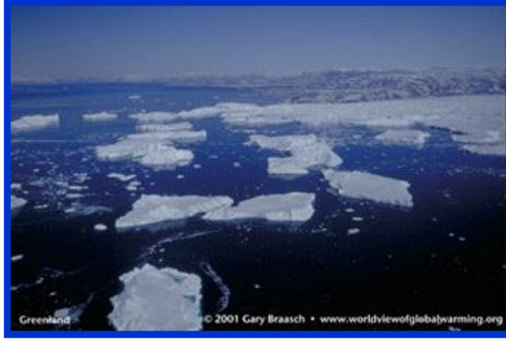
चित्र- 3 वैश्विक उष्णता की वजह से पिघलती बर्फ

हुआ है, समस्या यह है कि मनुष्य इस निरंतर प्रक्रिया को प्रभावी रूप से तेज कर रहा है यह समस्या पर्यावरण में प्रदूषण की वृद्धि की वजह से हुई है, और साथ ही वनों की कटाई और मनुष्यों की अन्यान्य विकासपरक गतिविधियां भी इसके लिए जिम्मेदार हो सकती हैं 7 ।