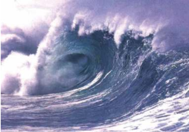
चित्र 1 समुद्र में सुनामी की लहरें दिखाया

हाली में जापान में हुये सुनामी से भयानक तबाही पूरे दुनिया में शोर मचा दिया। यह सुनामी कैसे पैदा होती है ? सुनामी के बारे में एक विस्तृत विश्लेषण किया है इस आलेख में। समुद्री तूफान को जापानी में सुनामी बोलते हैं, यानी बन्दरगाह के निकट की लहर। दरअसल ये बहुत लम्बी – यानी सैकड़ों किलोमीटर चौड़ाई वाली लहरें होती हैं, यानी कि लहरों के निचले हिस्सों के बीच का फ़ासला सैकड़ों किलोमीटर का होता है। पर जब ये तट के पास आती हैं, तो लहरों का निचला हिस्सा ज़मीन को छूने लगता है, – इनकी गति कम हो जाती है, और ऊँचाई बढ़ जाती है। ऐसी स्थिति में जब ये तट से टक्कर मारती हैं तो तबाही होती है। गति 400 किलोमीटर प्रति घण्टा तक, और ऊँचाई 10 से 17 मीटर तक। यानी खारे पानी की चलती दीवार। अक्सर समुद्री भूकम्पों की वजह से ये लहरें पैदा होती हैं। प्रशान्त महासागर में यह बहुत आम हैं, पर बंगाल की खाड़ी, हिन्द महासागर व अरब सागर में नहीं। इसीलिए शायद भारतीय भाषाओं में इनके लिए विशिष्ट नाम नहीं है।