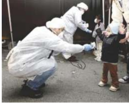
चित्र 8 रेडियेशन का खतरा