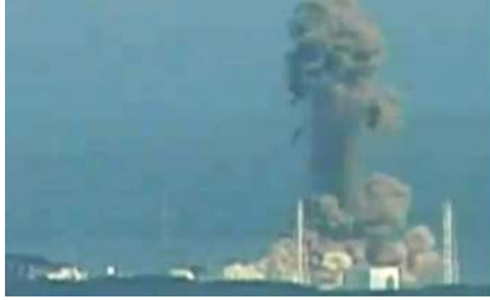
चित्र 9 सुनामी से हुये जापान की फुकुसीमा परमाणु केंद्र की तबाही

जैतापुर. इन बिजलीघरों से बनने वाली बिजली काफी कम, बहुत महंगी होगी और ज़्यादातर बड़े शहरों और औद्योगिक केंद्रों को बिजली दी जाएगी। ऊर्जा के क्षेत्र में आत्म-निर्भरता और प्रचुरता हासिल करने के कई विकेंद्रीकृत उपाय जानकारों ने सुझाए हैं लेकिन इसके लिये ज़रूरी राजनीतिक इच्छाशक्ति, ऊर्जा-कार्पोरेटों के खिलाफ़ जाने की हिम्मत और विकास की वैकल्पिक समझ हमारे सत्ता-तंत्र में नहीं है।