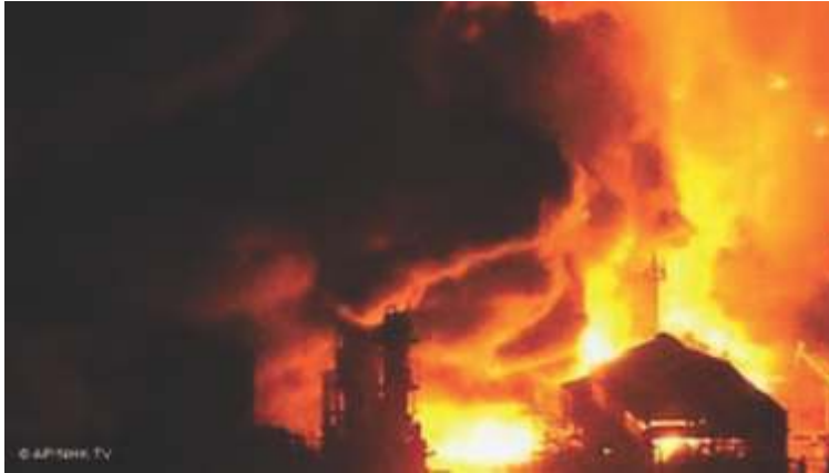
चित्र 6 सुनामी से हुये तबाही के नमूना