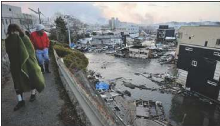
चित्र 7 सुनामी से हुये तबाही के नमूना