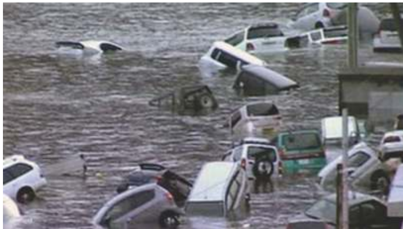
चित्र 4 सुनामी से हुये तबाही

हजारों कारें, जहाजें, ट्रेनें, बसें और इमारतें पानी के आगे रेत साबित हुईं और सुनामी की लहरों में बह गईं । स्विट्जरलैंड के जेनेवा शहर में स्थित रेड क्रॉस का कहना है कि सुनामी की लहरें इतनी ऊंची थीं, जितनी पहले कभी नहीं दिखीं । इसके बाद पूरे एशिया प्रशांत क्षेत्र में सुनामी की चेतावनी जारी कर दी गई ।