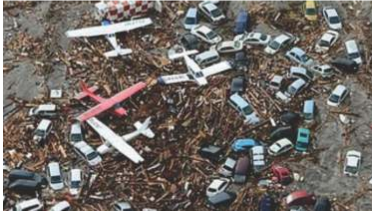
चित्र 5 सुनामी से हुये एक तबाही