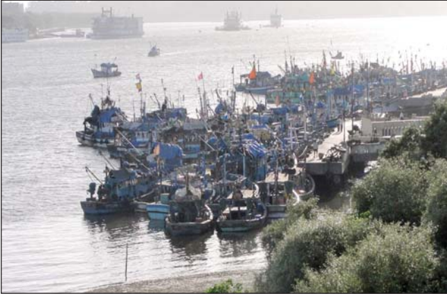
मालीम बंदरगाह, पणजी।