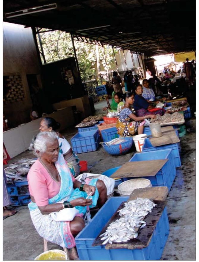
गोवा के पणजी इलाके में स्थित एक मछली बाजार।