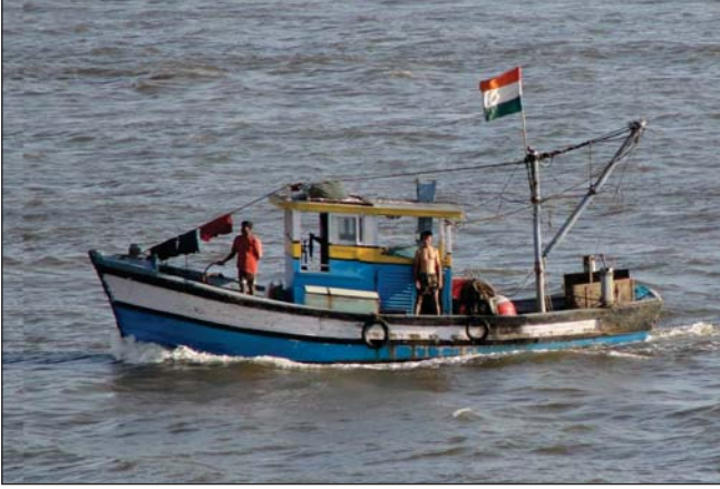
मछली पकड़ने का जालदार जहाज।